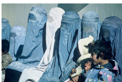
Mujeres en Afganistán