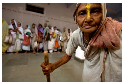
Mujeres en la India