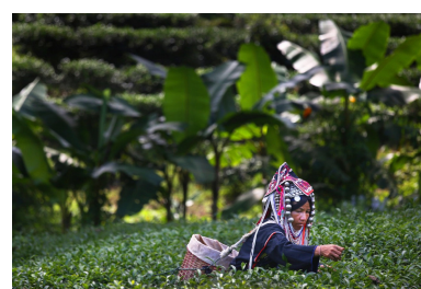
Mujer en Tailandia (a)