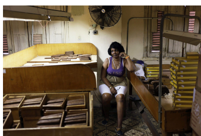
Mujer en Cuba (b)