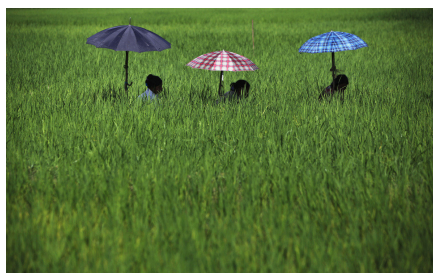
Mujeres en Nepal